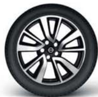
aliaj 19" (prelucrat)