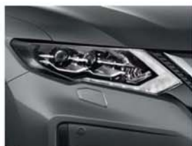
Metallic Grey - M - KAD