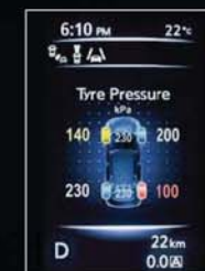
MONITORIZARE PRESIUNE PNEURI