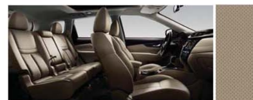
PIELE CU PERFORAȚII - BEJ