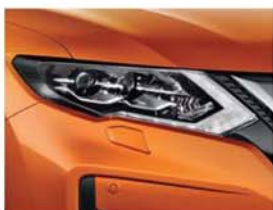
Orange - PM - EBB