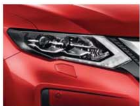
Ruby Red - PS - NBF