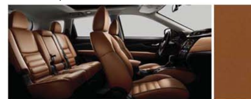
PIELE BRONZ CU EFECT 3D