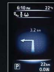
NAVIGAȚIE TURN BY TURN