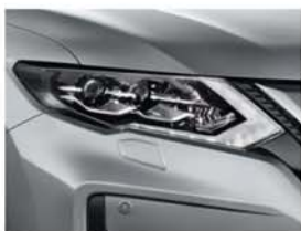
Silver - M - K23