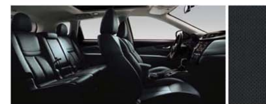
PIELE CU PERFORAȚII - NEGRU