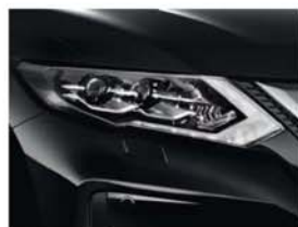
Black Pearl - P - G41