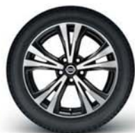
aliaj 18" (prelucrat)