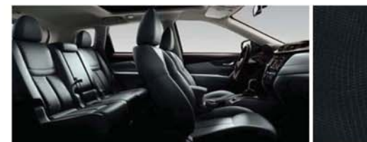
TEXTIL, TIP SUEDE