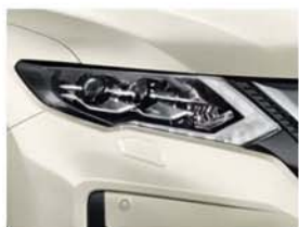
White Pearl - P - QAB