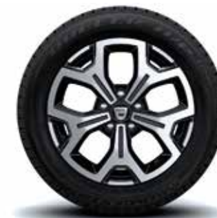
JANTE 17" MALDIVE