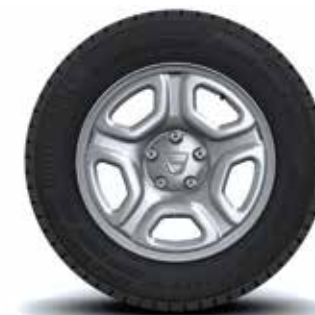
JANTE 16" FIDJI