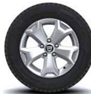
JANTE 16" CYCLADE