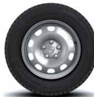
JANTE 16" OTEL