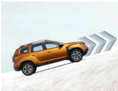
ASISTENȚĂ LA PORNIREA DIN RAMPĂ

Fie că mergi pe drumuri convenționale sau descoperi teritorii noi, Noul Duster știe mereu cum să se adapteze. Asistența la pornirea în rampă te ajută să cucerești și cele mai abrupte înălțimi, în timp ce, cu sistemul de asistență la coborâre ai controlul asupra vitezei în pantă. Camera MultiView te va ajuta în călătoria off-road, proiectând imagini din exterior pe ecranul Media Nav, pentru a-ți oferi o călătorie cât mai sigură și plăcută.