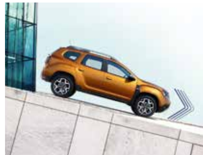
ASISTENȚĂ LA COBORÂREA PANTEI